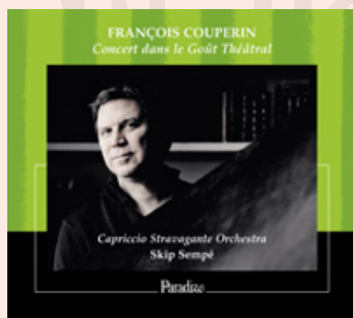
FRANÇOIS COUPERIN Concert dans le Goût Théâtral (Includes the complete Airs de cour ) Capriccio Stravagante Orchestra Skip Sempé / Gauvin / Rondot Desrochers / Lecornier CD / Paradizo PA0017