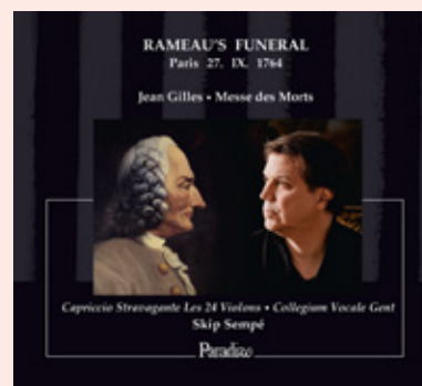
RAMEAU'S FUNERAL Paris 27. IX. 1764 Jean Gilles • Messe des Morts Van Wanroij, Getchell Sancho, Abadie Capriccio Stravagante Les 24 Violons / Collegium Vocale Gent / Skip Sempé CD / Paradizo PA0013