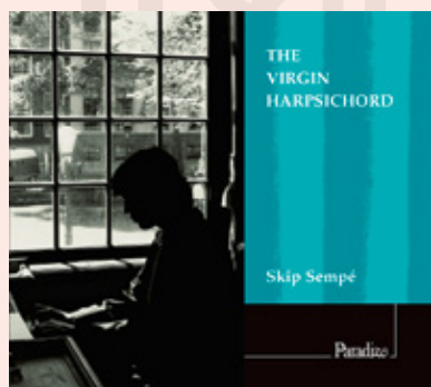
THE VIRGIN HARPSICHORD Byrd, Bull, Gibbons, Tomkins, Dowland, Philips Skip Sempé / Olivier Fortin Pierre Hantaï CD / Paradizo PA0016