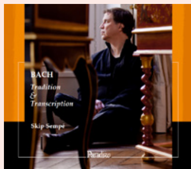
BACH Tradition & Transcription Skip Sempé, harpsichord Next release CD / Paradizo PA0018